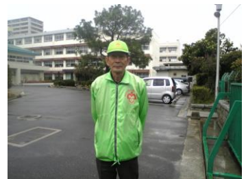
〈寺岡学校安全指導員〉

「学校だより 4 月号」でもお知らせしましたように、月に 2 度来校し、児童の安全を見守っています。